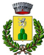
Comune di Monterotondo M.mo