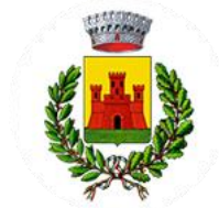
Comune di Monteverdi M.mo