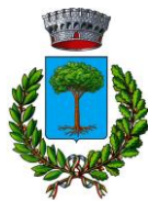
Comune di Castelnuovo V.C.