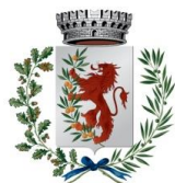
COMUNE di POMARANCE