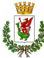
Comune di Volterra