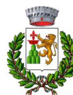
Comune di Montecatini V.C.

Strategia regionale per le Aree interne per il finanziamento di attività a valere sul PR FSE+ Toscana 2021-2027. Attività PAD 3.k.5 Inclusion e diffusione della pratica sportiva per i soggetti socialmente fragili, le persone a rischio di esclusione sociale e le persone con disabilità